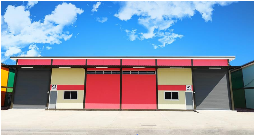
CHOD BIZ PARK @CHAENGWATTANA 38