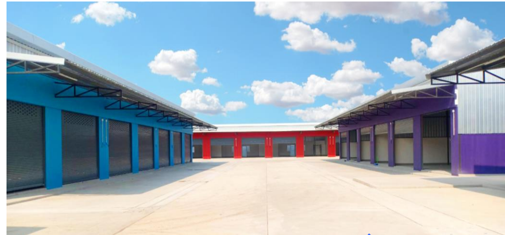
CHOD BIZ PARK @BANGNA KM.8