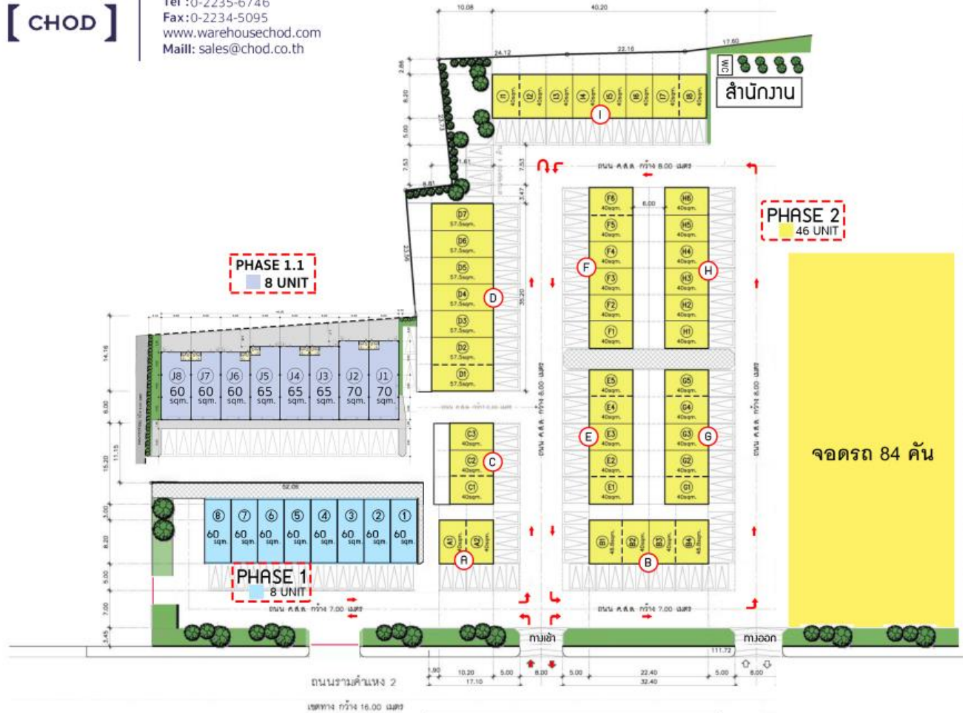
Master Plan Lay out Chod Biz Park@Bangna Km.8