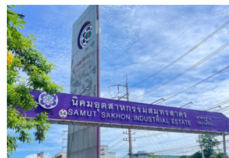
นิคมอุตสาหกรรมสมุทรสาคร (10.3 ก.ม.)