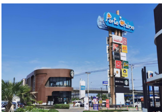
พอร์ต ซิตี้ (400 ม.)