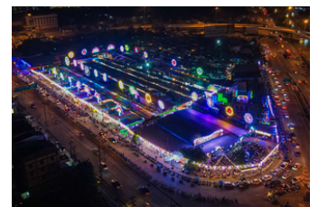
ตลาดมหาชัยไนท์ ต้นสน (3.9 ก.ม.)