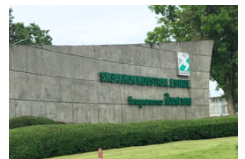
นิคมอุตสาหกรรมสินสาคร (11.8 ก.ม.)