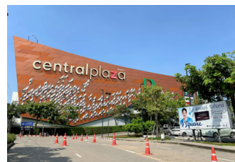
เซ็นทรัล มหาชัย (1.7 ก.ม.)