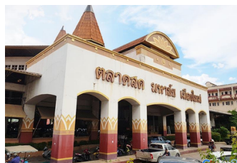
ตลาดสดมหาชัยเมืองใหม่ (10.1 ก.ม.)