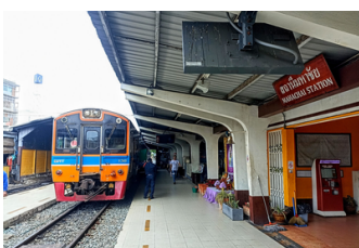
สถานีรถไฟมหาชัย (4.3 ก.ม.)