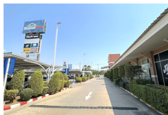
โฮมโปร มหาชัย (1.4 ม.)